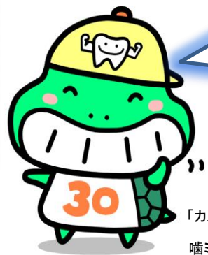
「カメ(噛め)ちゃん」国分寺市 噛ミング30(サンマル・食育推進キャラクター)